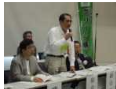
会員総会 報告時の役員席

実施日：2017年6月2日(木) 会場：コラボしが213階 大会議室 出席者数：総会 出席正会員数 294 団体 (うち出席 104 団体、委任状 190 団体) 出席者数 135 人 審議事項：・2016 年度事業報告および決算報告について ・第 3 期理事および第 3 期監事の選任について 報告事項：・アドバイザーおよび第 3 期幹事について ・2017 年度事業計画・予算について