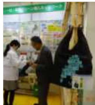
公式エコバッグ(手前)と 来場者にバッグを手渡すスタッフ

アインズ(株) (株)滋賀建機 アヤハグループ (公財)滋賀県産業支援プラザ (株)エコパレット滋賀 新江州(株) (公財)淡海環境保全財団 西村建設(株) 大阪ガス(株) 日本テクノ(株) (株)木下カンセー (株)平和堂 (株)三東工業社 前出産業(株) (株)滋賀銀行 (株)山久 滋賀 GPN