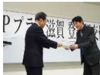
GPプラン滋賀 登録証交付の様子