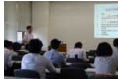
自治体のグリーン購入 担当者連絡会議