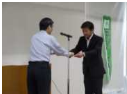
びわ湖チャリティー100km 歩行大会実行委員会様 への感謝状贈呈の様子