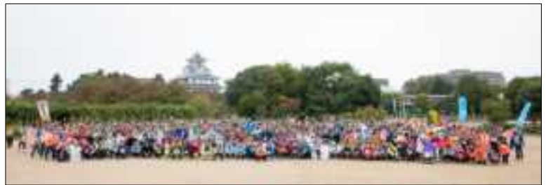
びわ湖チャリティ100km歩行大会