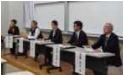
パネルディスカッション