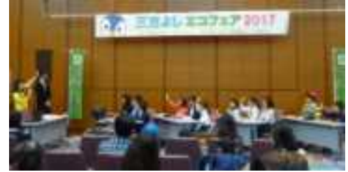
子どもエコ座談会

2017年12月9日(土) 来場者:約1500名 会場:ピアザ淡海 3階 大会議室 主催:滋賀GPN 後援:滋賀県、大津市、滋賀県教育委員会、 大津市教育委員会