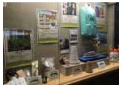
ディスプレイ展示の様子

5月1日～31日 滋賀県東京事務所ディスプレイにて 商品・サービス部門受賞6商品を展示