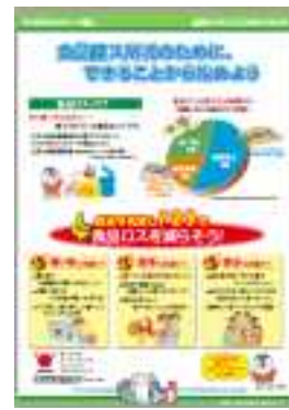
食品ロス削減に関する啓発パネル