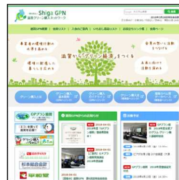
新ホームページのトップページ