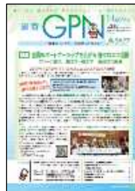
ニュースレター第 33 号