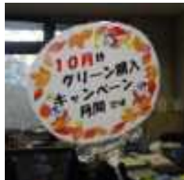
窓口に設置された キャンペーン・ポップ (草津市役所)

会員の内外にグリーン購入を拡大する取り組み強化月間。今年度は次の3つの取り組みを呼びかけ、会員130団体が参加してそれぞれ自主的な取り組みを展開した。