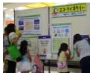
エコっ子フェスティバル エコクイズ・ラリー