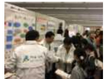
草津市子ども環境会議