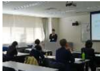
グリーン購入基礎研修会

各回とも滋賀県会計管理局管理課と滋賀 GPN 事務局が講師を務め、滋賀県グリーン入札制度とグリーン購入の基礎的な考え方、取り組み方について説明した。