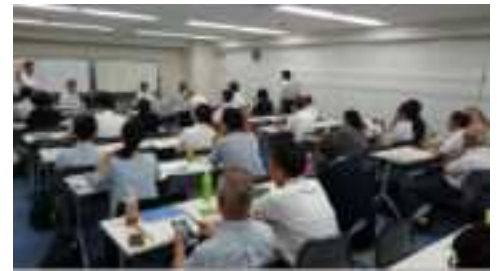
生物多様性と環境・CSR 研究会セミナー