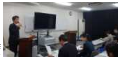
実践講座 県 管理課 青木氏報告風景

※実践講座では毎回、滋賀県 会計管理局管理課による 「滋賀県グリーン入札について」の報告も実施した。