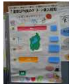
三方よしエコフェア