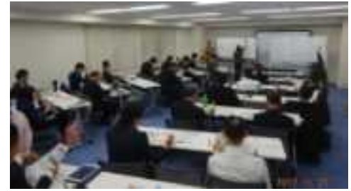
エコ通勤研究会セミナー