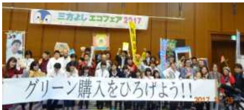
三方よしエコフェア2017

また、「おおつエコフェスタ2017」や「草津こども環境会議」等、各種の地域イベントに参加して「環境に配慮した暮らし方」の普及拡大に努めた。