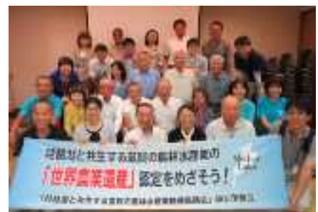
参加メンバーの記念写真

内 容：・魚のゆりかご水田の現地見学 ・稲刈り体験 ・漁民の森見学と取組説明 他