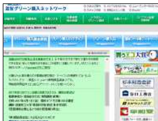
2017年4月1日現在のホームページ