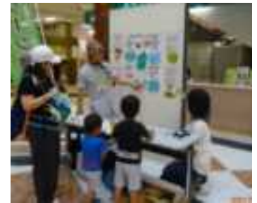
エコっ子フェスティバル 食のGP研究会ブース