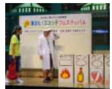
エコっ子フェスティバル 啓発劇「ゴミステスト!」の一場面