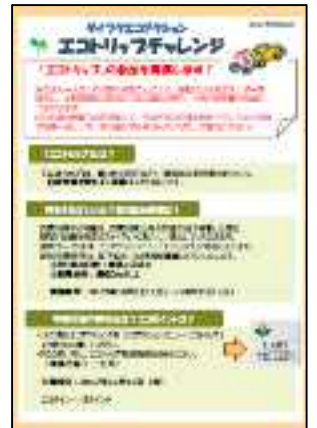
全社員に配布されたチラシ (株)ダイフク)