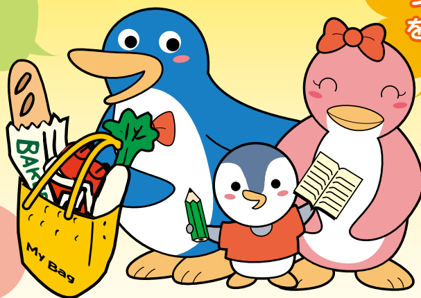
SGNキャラクター エコペン・ファミリー