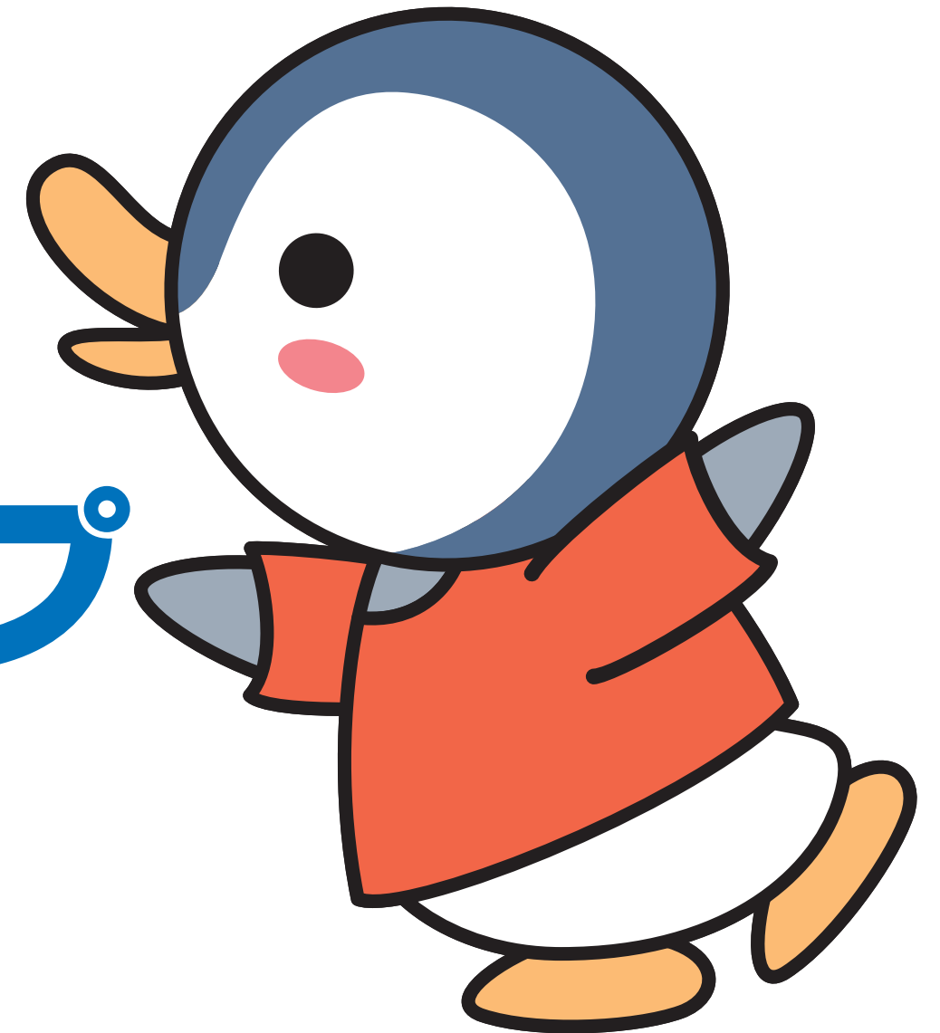
滋賀 GPN マスコットキャラクター：エコペン