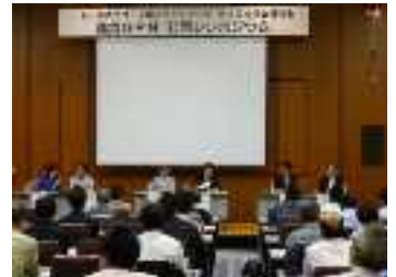
公開シンポジウム