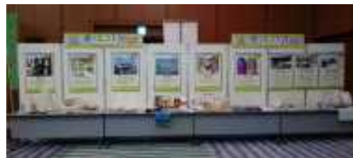
三方よしエコフェア時の展示