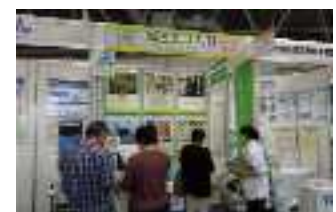
ビジネスメッセ 出展風景