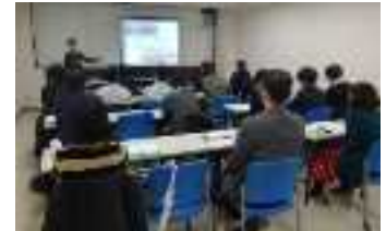
自治体地域エネルギー会議