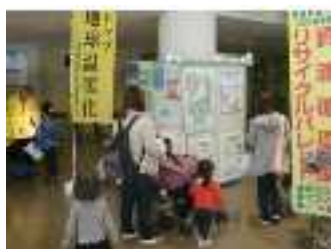
甲賀市のブース啓発