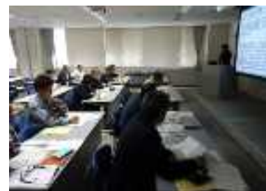
グリーン購入基礎セミナー

各回とも滋賀県会計管理局管理課と滋賀GPN事務局が講師を務め、滋賀県グリーン入札制度とグリーン購入の基礎的な考え方、取り組み方について説明した。 なお、4/13、7/28は「グリーン購入基礎セミナー」として実施した。