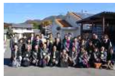
地域エネルギー交流見学会 参加者集合写真