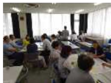
実践講座 前期 2

前期 4 2016 年 8 月 30 日（火） 大津会場 参加者：40 名 「エシカル購入の勧め」 講師：東京大学 名誉教授 山本 良一氏