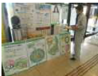
高島市の展示風景