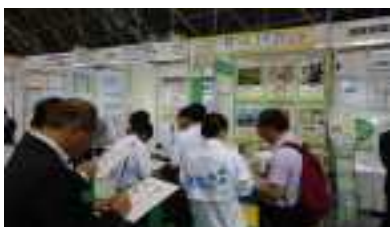
ビジネスメッセにおける「来場者投票」