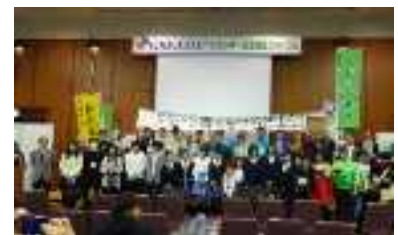
三方よしエコフェア オープニングセレモニーの様子

※「エネルギー体験学習会」は平成 28 年滋賀県地域エネルギー活動支援事業補助金により開催