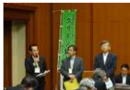
会員総会での2015年事業報告の様子