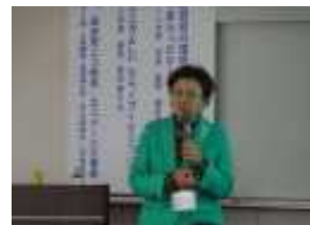
グリーン購入フォーラムの様子