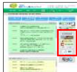
滋賀 GPN ホームページ