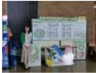
湖南市の展示風景