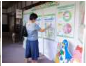
甲良町の展示風景