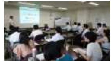
第1回自治体のグリーン購入担当者連絡会議