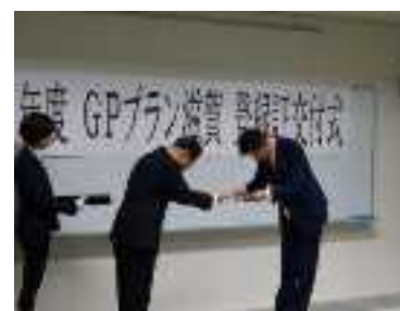
登録証交付式の様子